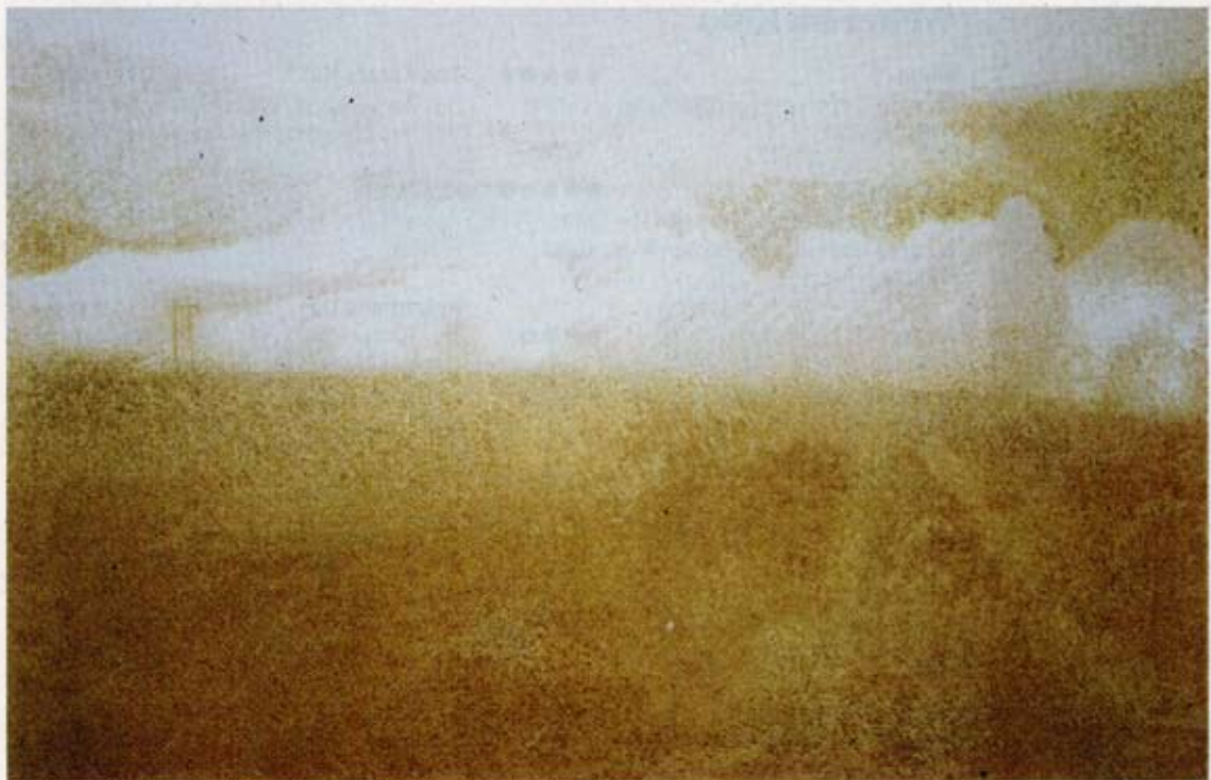
Andrea Blaser: «Kulinarischer Siebdruck», 55,5 x 51 cm.